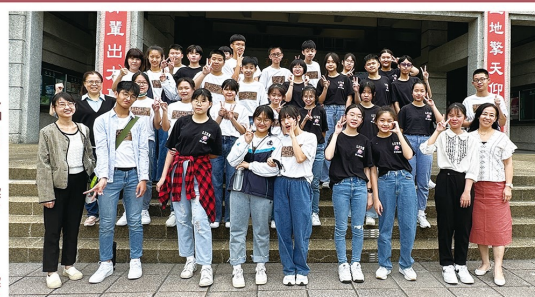
國中部學生參加112年度臺中市國中英文歌唱比賽榮獲優等