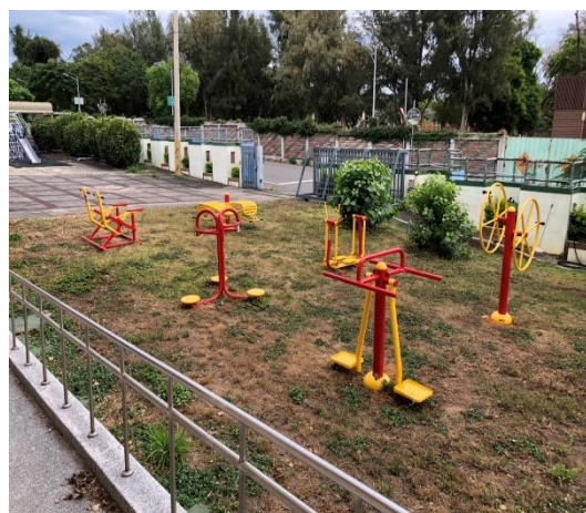
宿舍外有籃球場及遊樂設施