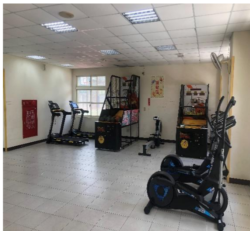
一樓設有籃球機、健身器材