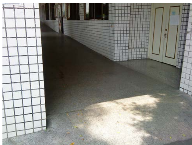
立志樓無障礙通道