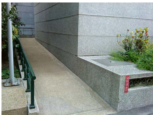
立人樓無障礙通道